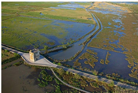
La Tour Carbonnière