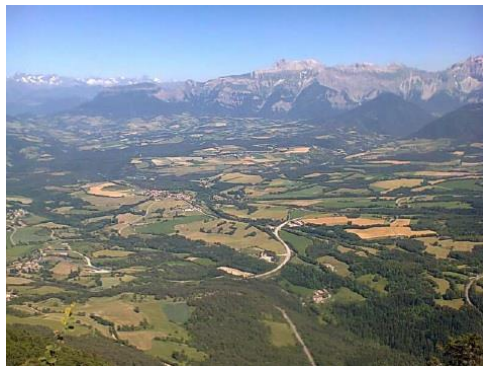
Légende © crédit