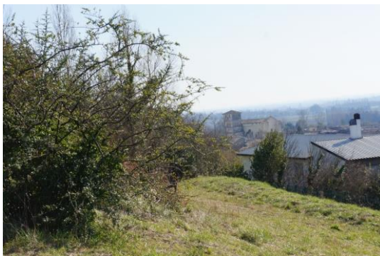
Des vues et sentes à redécouvrir

Pourtant de nombreux points d'appuis à différentes échelles permettent de mettre en relief des sites uniques mais également la mémoire des lieux, notamment au