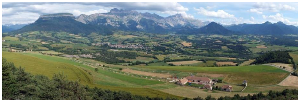
Légende © crédit

Lauréat 2013 de l'appel à projet Plans de Paysage* organisé par le ministère de la transition écologique et solidaire, le Trièves entend se doter par ce biais d'une vision partagée, pour appréhender ces problématiques sous l'angle de la cohérence globale d'un projet à même de fédérer les forces vives du territoire