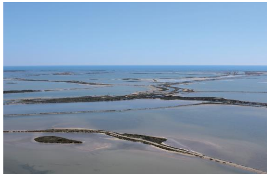
Légende © crédit

[Facultatif : Le programme de la restitution sera accessible ici :]