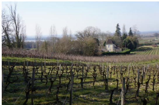
Propriété viticole

A mi-chemin entre deux biens UNESCO (St Emilion et La citadelle de Blaye), les paysages de la commune sont en pleine mutation du fait d'une forte croissance démographique et urbaine.